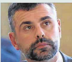
SANTI VILA Conseller de Territori

■ "Ha destacado la importancia de seguir apostando por un modelo de economía productiva, con un acusado sentimiento de solidaridad que garantice el Estado de bienestar"