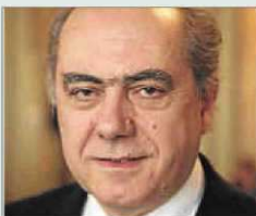
SENÉN FLORENSA Institut Europeu de la Mediterrània

■ "Es un político joven y experimentado, del que destaco su compromiso de llegar a un acuerdo con democracia y seguridad jurídica"