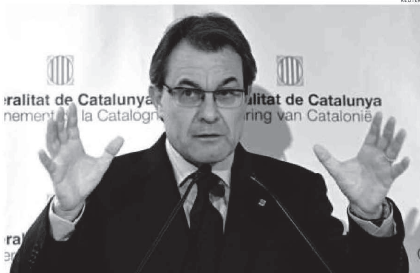
PRESIDENTE. Mas insiste en el derecho de los catalanes a pronunciarse en una consulta

La posibilidad de realizar una consulta es "lo importante" y, por tanto, a lo que se ha comprometido a hacer en la próxima legislatura si logra una amplia mayoría en las elecciones del próximo 25